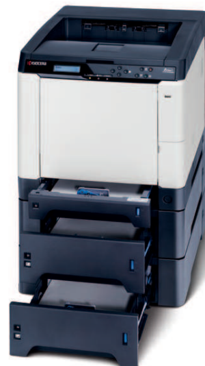
Produkt je zobrazen včetně volitelných doplňků.