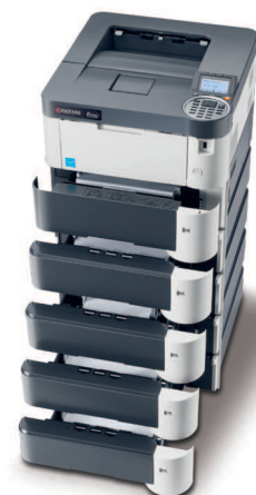
Produkt je zobrazen včetně volitelných doplňků.